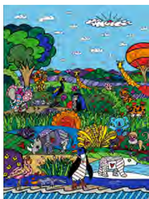
WILDLIFE ALLIANCE 〔版画〕 76×57 cm ¥660,000 (ED100)