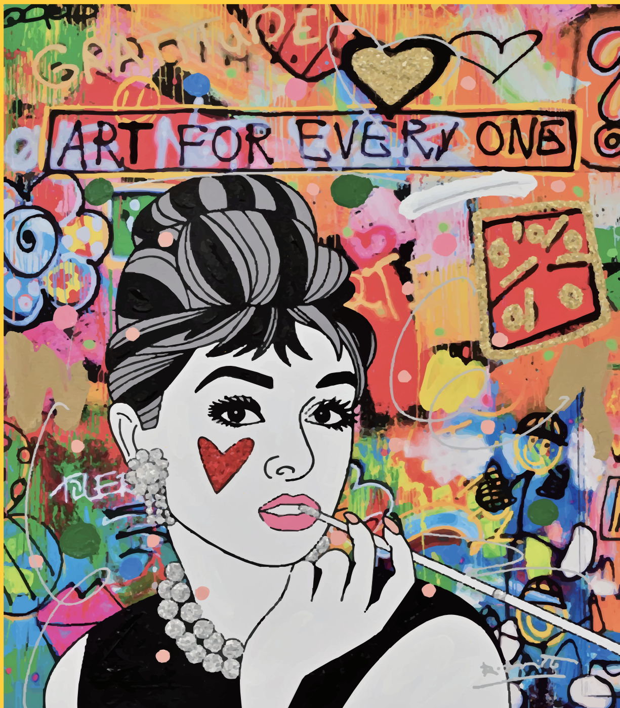
BREAKFAST AT TIFFANY [版画] 76×61cm ¥902,000