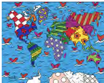
SMALL WORLD 〔版画〕 28×36 cm ¥385,000 (ED1,000)