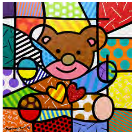
HAPPY (BEAR) 〔版画〕 61×61 cm ¥440,000 (ED1,000)