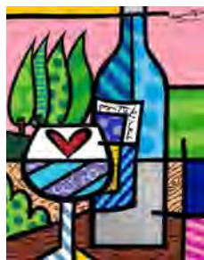
TO HAPPINESS 〔版画〕 36×28 cm ¥407,000 (ED1,000)

世界中で多くのファンに愛される、明るいポップなロメロ ブリットの アート作品を福岡天神で展示販売いたします。見る人を HAPPY にする ロメロの世界観を、この機会にぜひお楽しみください！