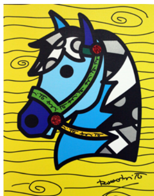
COUNTRY HORSE [版画] 36×28 cm