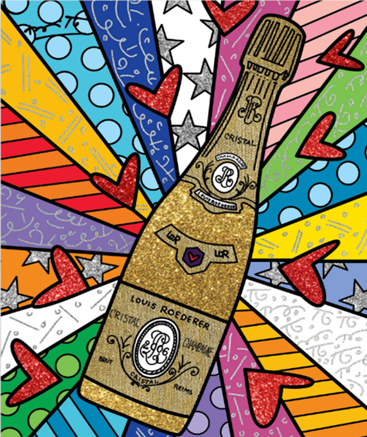
LET'S CEREBRATE [版画] 51×41cm