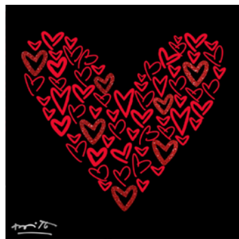
GOOD NIGHT LOVE [版画] 41×41 cm