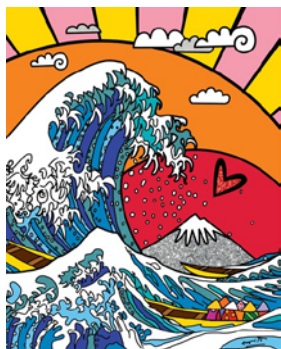
THE GREATEST WAVE [版画] 76×61 cm

昨年に続き、今年もロメロブリットの明るいポップアート作品を福岡・天神で展示販売します。 今年は展示数を増やし、より多彩な作品をお楽しみいただけます！ 世界中で多くのファンに愛される、見る人を HAPPY にするロメロの世界観を、この機会にぜひお楽しみください！