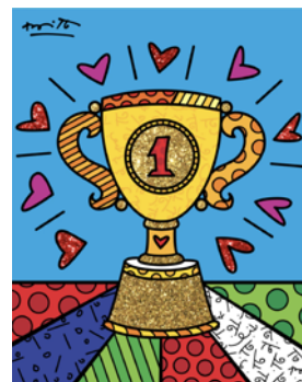
YOU ARE MY NUMBER 1 [版画] 36×28cm